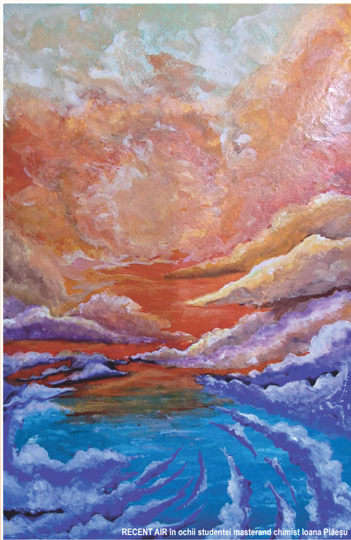
RECENT AIR în ochii studentei masterand chimist Ioana Plăeșu